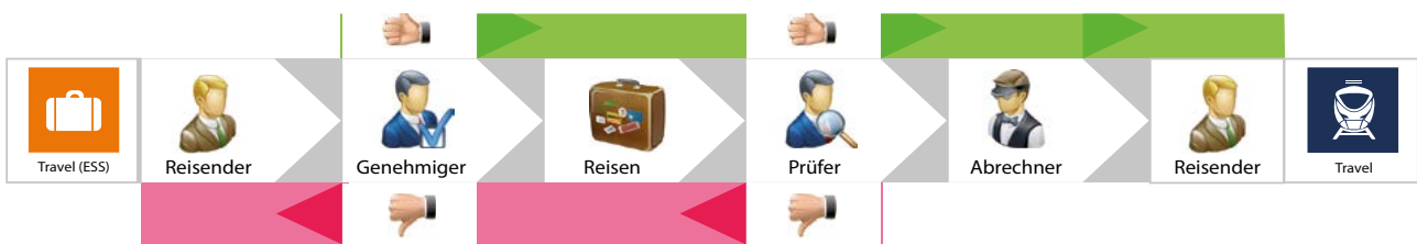
Grafik: Beispiel KIDICAP.Travel – Workflow mit SelfService

und Abrechnung von Dienstreisen integriert und per E-Mail über jeden Status informiert oder beauftragt. Durch die im Produkt hinterlegten aktuellen Gesetzesregelungen und individuellen Reiserichtlinien sind alle Voraussetzungen für die rechtskonforme Abrechnung Ihrer Dienstreisen gegeben. Plausibilitätstests im Verfahren geben Ihnen zusätzliche Sicherheit.